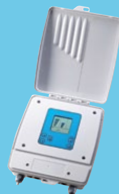
Caja de mando